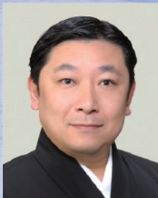
常磐津 和英太夫(浄瑠璃)

2017年9月9日(土) 午後3時開演 ※午後2時30分開場 三越劇場(日本橋三越本店6階) / 6,000円(全席指定・税込)