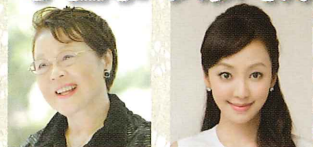
市原悦子 (女優) 神田うの (モデル)