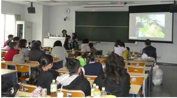
文教大学越谷キャンパス12号館104教室にて 各班の写真発表を視聴する38名