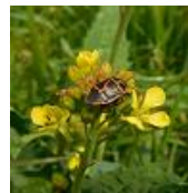
カラシナの上の カメムシ