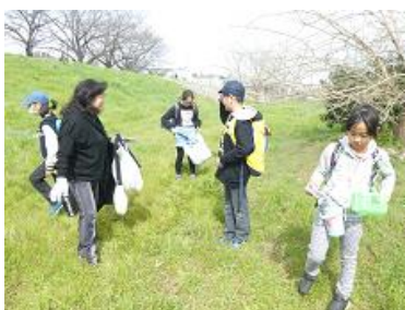
ノビルはどこかな…