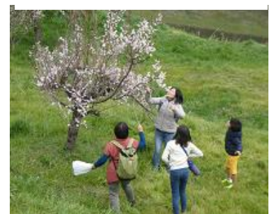
ウメの木にビール袋が…