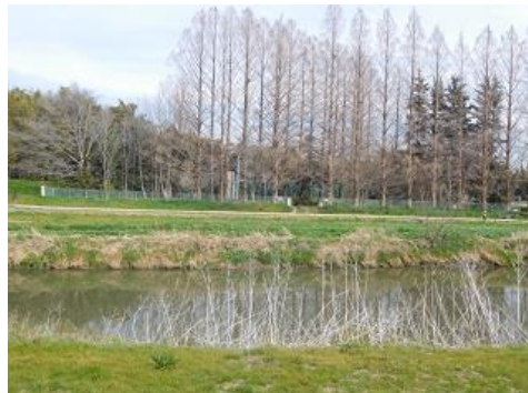
早春の元荒川 美しい情景を楽しむ