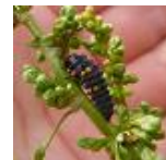
テントウムシ の幼虫