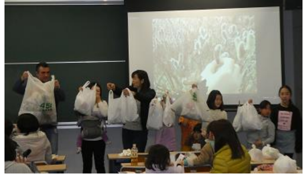
ゴミを拾ってきれいになったでしょう 各班が拾ったゴミを見せあう