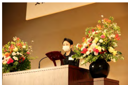
祝辞 (足立区 近藤やよい区長)