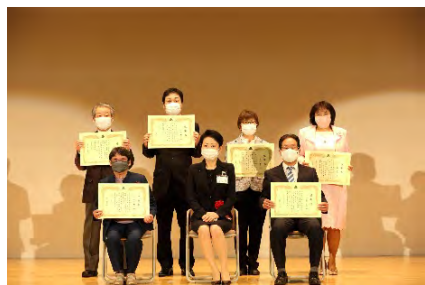
人道橋名称表彰式

※新型コロナウイルス感染防止のため、当日は政府及び足立区のガイドラインに従い、対策を徹底のうえ開催いたしました。