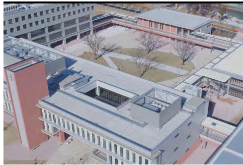
↑内庭のケヤキは足立区の保存樹