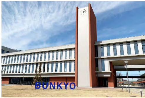
↑キャンパスのシンボルとなる時計塔